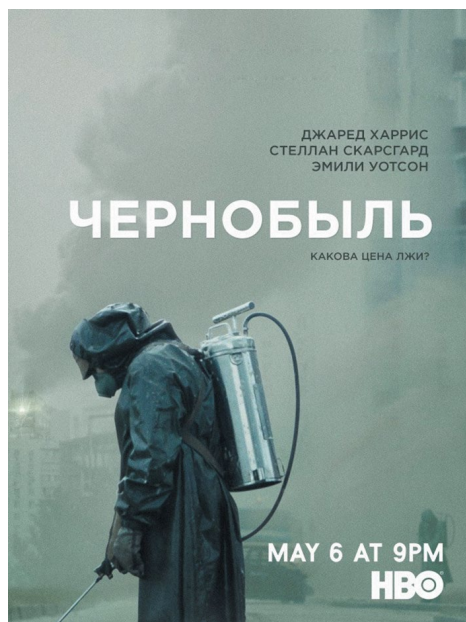
Рис. 3. Постер сериала «Чернобыль» 3

Между тем культурологических работ, посвященных исследованию последней волны кинофальшивок, пока не предпринимается.