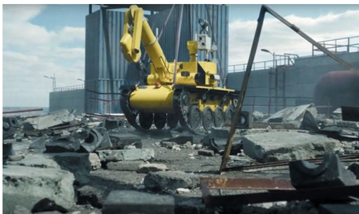
Рис. 9. Робот «Джокер», кадр из сериала «Чернобыль» 9

Перечисление исключительно сюжетных тропов может значительно затянуться, их можно выделить более двух сотен, и потому давайте рассмотрим троп художественный. Как можно было убедиться по представленным фрагментам, сериал на этапе постпроизводства подвергся значительной цветокоррекции. Краски приглушены, тон изображения уведен в сепию, практически нет ярких красок, кроме, разве, немецкого робота, трактора-манипулятора в одной из сцен, да и здесь он является лишь ярким пятном, на фоне которого еще сочнее проступает атмосфера тусклости и уныния, характеризующая жизнь в СССР. Отдельно отметим низкую эффективность этого трактора в реальной жизни: «потребовались роботы для проведения определенной работы — их сделали за 2–3 недели, причем лучше, чем французские и итальянские» [15, с. 138]. Хотя, конечно, трудно себе представить Припять, молодой город комсомольской стройки, без красных флагов и транспарантов.