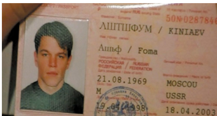
Рис. 2. Кадр из фильма «Идентификация Борна» 2 Fig. 2. Screen capture from the film The Bourne Identity

Однако организованное противодействие ученых лишь еще более подогревает интерес к альтернативной истории в медиа, в результате только усиливая конспирологические тенденции. Упомянутые выше тенденции не могли остаться вне поля зрения большого кинобизнеса. Стоит отметить, что до последнего времени даже самые высокобюджетные голливудские ленты отличались пренебрежением к мелким деталям, достаточно вспомнить известный кадр с тарабарщиной в русском паспорте Борна, где вместо русских фамилии и имени вписан непонятный набор букв Ащф Лштшфум. («Идентификация Борна», реж. Даг Лайман, США, Германия, Чехия, 2002)