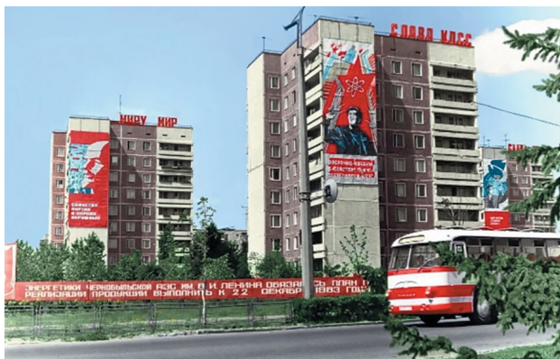
Рис. 10. Город Припятъ в 1984 году 10