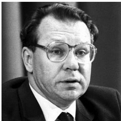
Рис. 4. Валерий Алексеевич Легасов 4

страничного доклада о последствиях катастрофы в МАГАТЭ, воспоминания, которые, по словам авторов сериала, послужили его основой.