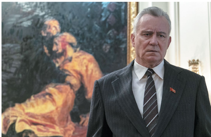
Рис. 6. Кадр из сериала «Чернобыль» 6

власти и о вековой русской традиции угнетения, а основным драматургическим ходом является так называемый «героизм вопреки», — победа, достигаемая в борьбе не только с угрозой катастрофы, но и с противодействием неких начальствующих сил, которые в сериале представлены всемогущими партаппаратчиками и сотрудниками КГБ.