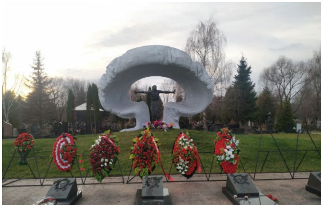
Рис. 8. Чернобыльский мемориал на Митинском кладбище 8