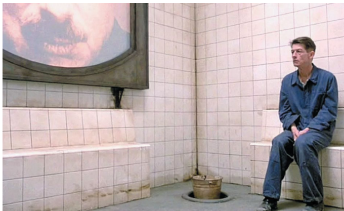
Рис. 12. Кадр из фильма «1984» 12