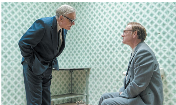
Рис. 11 Сцена допроса академика Легасова, кадр из сериала «Чернобыль» 11

Этот прием не случаен — такая цветокоррекция четко ассоциируется у зрителя (особенно западного) с подавлением, насилием, со сбывшейся антиутопией. Не случайны и другие прямые параллели — сцена разговора академика Легасова с сотрудником КГБ в камере показана идентично с камерой Министерства Правды в фильме 1984 (реж. М. Рэдфорд, Великобритания, 1984).