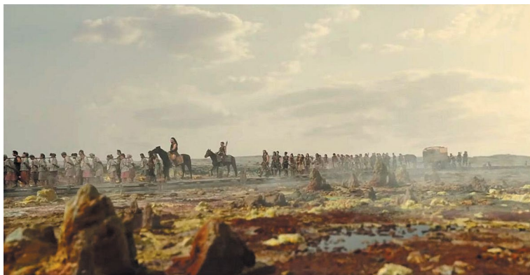
Рис. 6. Кадр из южнокорейского сериала в жанре фэнтези «Хроники Асдаля» (TvN, Netflix, 2019, сер.3) 5

ная разработка вымышленного мира. Были выделены художественные и технические приемы, позволившие создать подчиненное единой внутренней логике пространство, в котором разворачивается сюжет телеповествования.